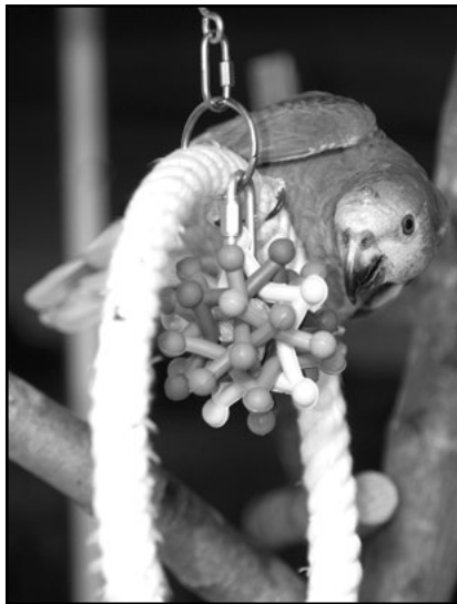
Kuvassa kultaposkiamatsoni yrittää saada pähkinää ulos koiran purulelusta.