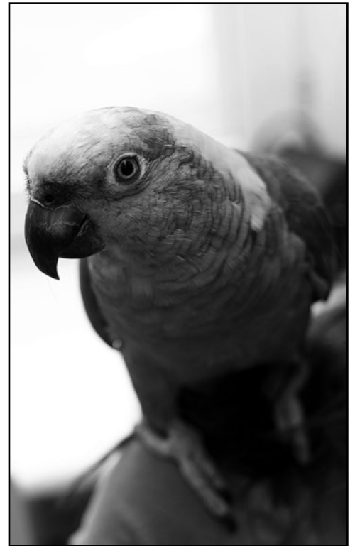
Muun muuassa keltaniska-amatsoni (Amazona auropalliata) kuuluu CITES-liitteeseen I ja vaatii myyntiluvan.

Suomessa ei ole olemassa virallista määritelmää kasvattajalle, mutta kasvattajaksi mielletään yleensä säännöllisesti ja suunnitelmallisesti lintujaan pesittävä henkilö, jolla on jo pitkä kokemus