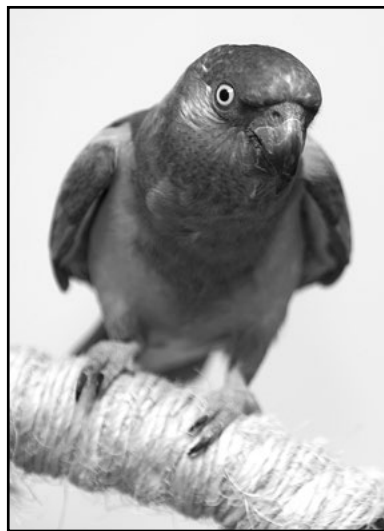
Senegalinkaija on tyypillinen pienikokoinen papukaija ”ison linnun luonteella”

Moniin pienempiin papukaijalajeihin voi luoda samankaltaisen suhteen, kuin isompaankin lintuun. Niille pystyy kuitenkin luomaan rajoitetussa tilassa paremmat olosuhteet ja helpommin hankkimaan seuraksi toisen linnun. Esimerkiksi neitokakadu voi olla sosiaalinen lemmikki, joka voi lajitoverien lisäksi viihtyä ihmisseurassa ja jolle on mahdollista opettaa erilaisia temppuja.